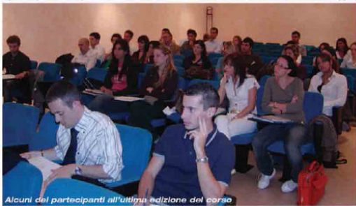
Alcuni dei partecipanti all'ultima edizione del corso

Il corso completo ha durata biennale e le due annualità si svolgono ciascuna dal mese di settembre al mese di aprile/maggio dell'anno successivo. Sia il primo che il secondo anno prevedono circa 220 ore di frequenza ognuno, strutturati entrambi su quattro moduli. Ognuna delle due annualità prevede l'alternanza di lezioni di teoria applicata ad esercitazioni pratiche vere e proprie. Il primo anno verte principalmente su argomenti di impostazione ed analisi di bilancio. Il primo modulo (che si svolge da settembre a novembre 2009) è dedicato alla Disciplina civilistica in