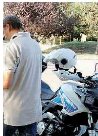
task force della Municipale in azione